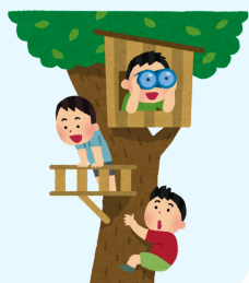
Parque Europa* (Actividades multiaventuras incluidas)