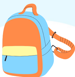
Day trip (Escapadas semanales)