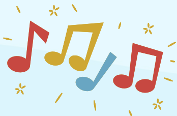
Sing & Dance (Música, ritmos y bailes)