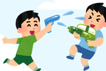
Pool Party* (Todos los viernes al finalizar la semana temática)