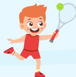
Games (juegos y actividades diseñados por temática)