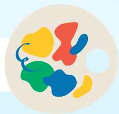
Art & Crafts (Manualidades)