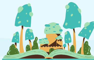
Free Play (juego libre para que pongan en marcha su imaginación)